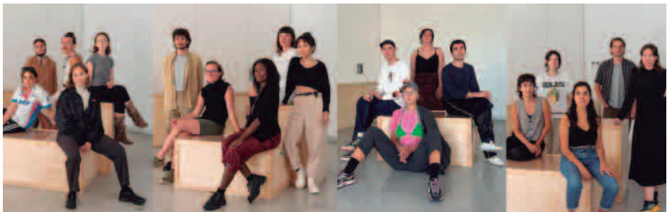
Los veinte jóvenes participantes en "Praxis" fueron seleccionados entre 98 candidatos de 35 países / (f) fluent

El objetivo de la propuesta es acercar el lenguaje de la danza a cinco colegios de la ciudad. Para eso, se propone un conjunto de actividades que contemplan cinco representaciones de espectáculos de danza en el patio de cada colegio, en formato sorpresa durante la hora del recreo, sobre el que reflexionarán posteriormente en clase y cinco talleres de movimiento y expresión corporal para el alumnado.