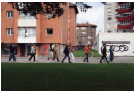
"Delascalles un museo" es un proyecto vivo y reflexivo que viene desarrollándose desde 2018

de Santander. Esta iniciativa ofrece al público una selección de micro teatro (piezas de duración máxima de 15 minutos) que son representadas de forma simultánea en diferentes salas de un mismo espacio y en un ambiente cercano e íntimo. Los espectadores pueden disfrutar de todas las obras programadas para cada fecha e ir rotando por los diferentes espacios del lugar seleccionado hasta ver todas ellas en una misma sesión. La temática que ha articulado esta decimoprimer edición ha sido "el futuro".