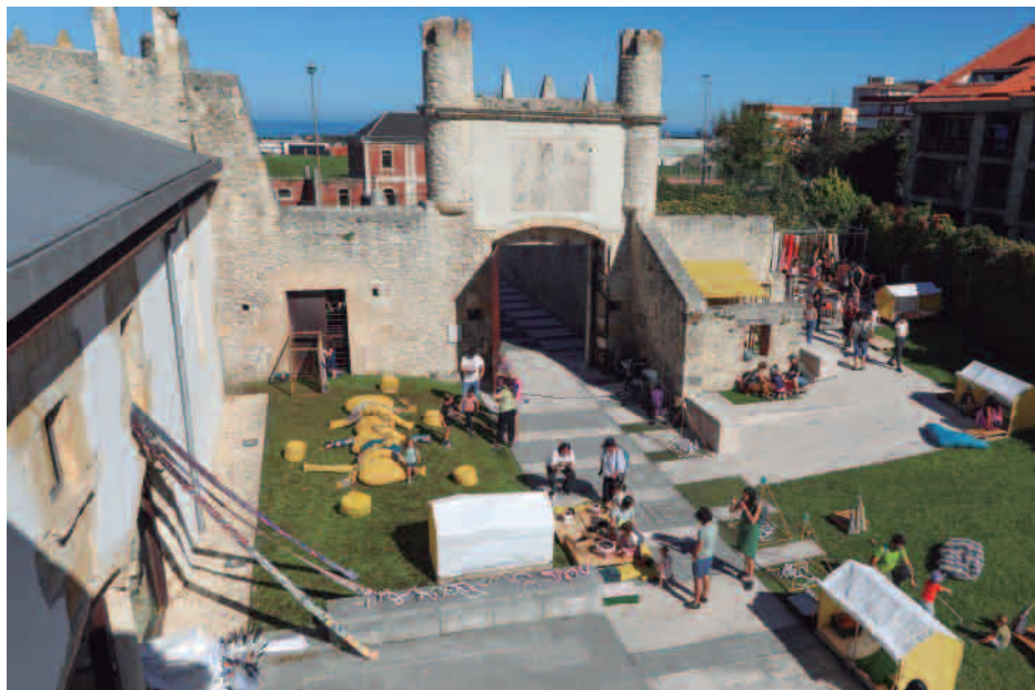
El jardín exterior de Enclave Pronillo fue escenario de los talleres infantiles de "Archipiélago Serendipia"

festivales y reconocidas por distintas instituciones con galardones de prestigio. Cada una de las proyecciones documentales se acompaña de una presentación para contextualizar las películas y de un coloquio tras su visualización, con la participación de miembros de los equipos creativos y expertos en las diferentes temáticas tratadas. La propuesta se enriquece con actividades complementarias al ciclo. Se trata de una actividad interdisciplinar que va mucho más allá de lo puramente cinematográfico.