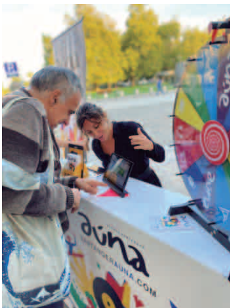
Uno de los puestos informativos, situado en la Plaza Alfonso XIII

La Fundación sigue trabajando para mantener la esencia que impulsó la creación de la agenda: ofrecer un servicio público de calidad ayudando a comunicar, promover y valorar la oferta cultural existente con independencia de quién sea el programador o el lugar en el que se realice la actividad.