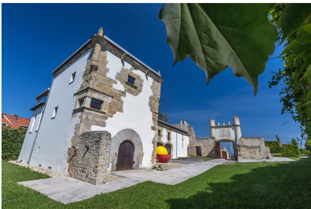
Vista del exterior de Enclave Pronillo

Ubicado en la Av. General Dávila 129 A (frente al depósito de aguas), ENCLAVE PRONILLO abre sus puertas en 2012 y desde esa fecha se pone a disposición del sector cultural de la ciudad y su entorno, a través de un programa anual de cesión gratuita de espacios, para que las empresas culturales, asociaciones y otros colectivos desarrollen sus propias acciones en sus instalaciones, bajo la supervisión de la Fundación.