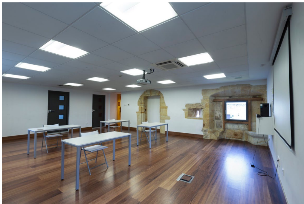
Espacio aula