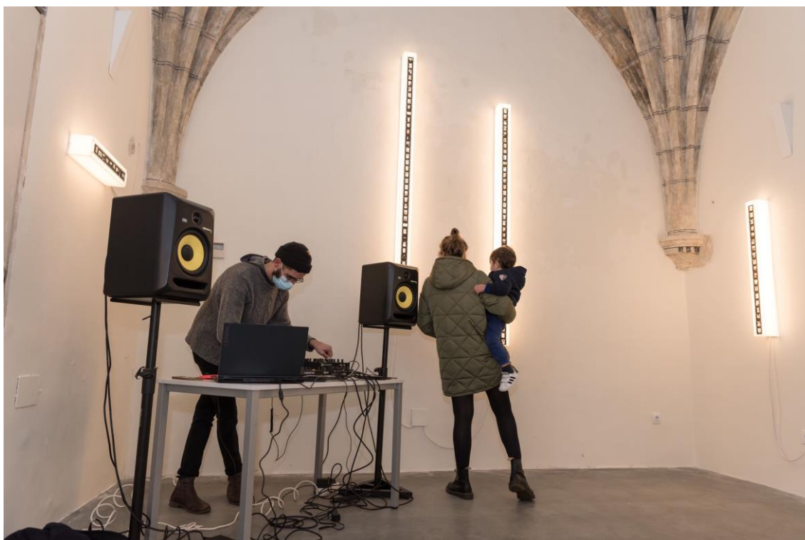
El músico JPEGr, que cuenta con una dilatada trayectoria profesional vinculada al diseño sonoro, ofreció una sesión de música electrónica durante la inauguración de la instalación.

En la exposición la ciudadanía encontraba varias cajas de luz construidas con metacrilato dentro de las que podrá contemplar fotografías de carné de aquellos agentes culturales que han participado en la iniciativa y cuyos proyectos han sido apoyados por la FSC en sus primeros diez años de existencia.