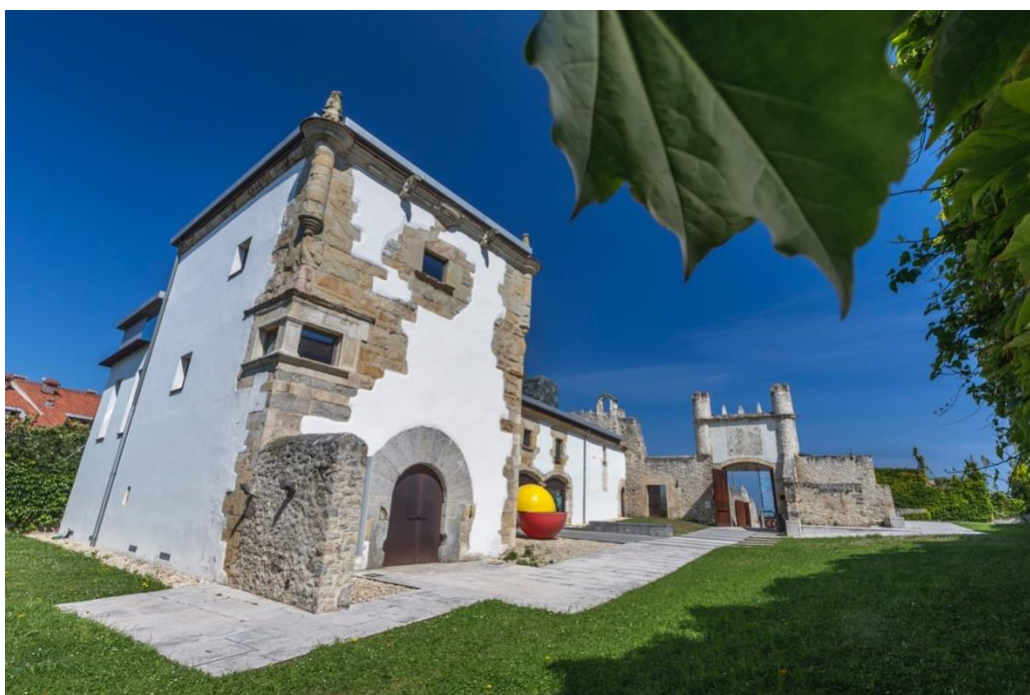
Vista del exterior de Enclave Pronillo

Ubicado en la Av. General Dávila 129 A (frente al depósito de aguas), ENCLAVE PRONILLO abre sus puertas en 2012 y desde esa fecha se pone a disposición del sector cultural de la ciudad y su entorno, a través de un programa anual de cesión gratuita de espacios, para que las empresas culturales, asociaciones y otros colectivos desarrollen sus propias acciones en sus instalaciones, bajo la supervisión de la Fundación.